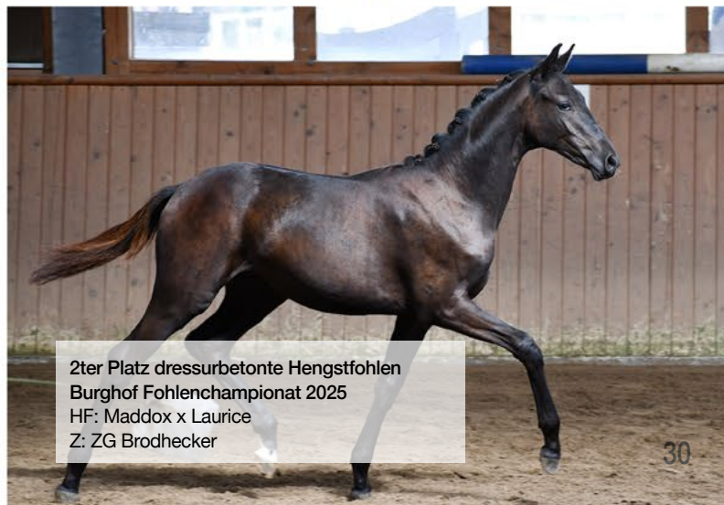
2ter Platz dressurbetonte Hengstfohlen Burghof Fohlenchampionat 2025 HF: Maddox x Laurice Z: ZG Brodhecker