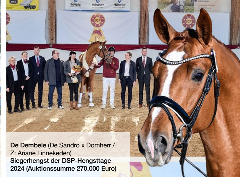
De Dembele (De Sandro x Domherr / Z: Ariane Linnekeden) Siegerhengst der DSP-Hengsttage 2024 (Auktionssumme 270.000 Euro)