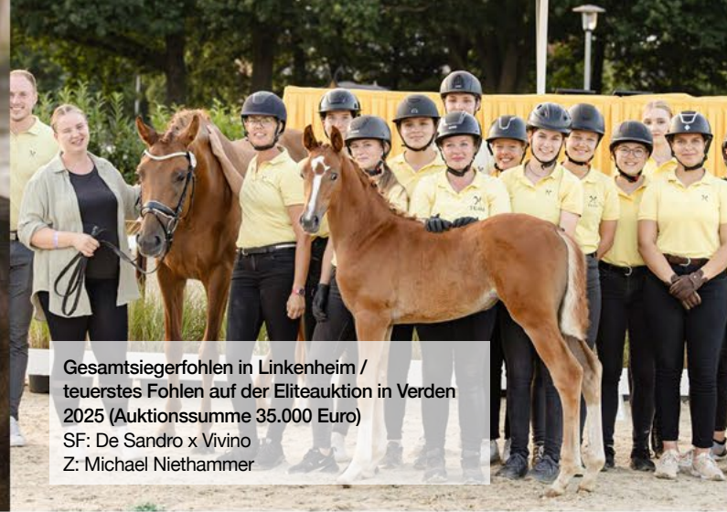
Gesamtsiegerfohlen in Linkenheim / teuerstes Fohlen auf der Eliteauktion in Verden 2025 (Auktionssumme 35.000 Euro) SF: De Sandro x Vivino Z: Michael Niethammer