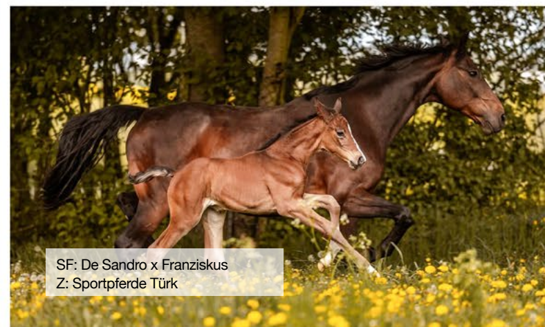
SF: De Sandro x Franziskus Z: Sportpferde Türk