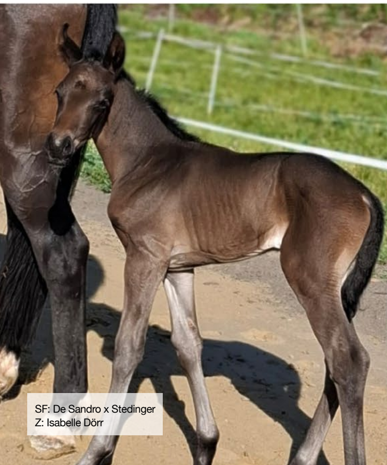
SF: De Sandro x Stedinger Z: Isabelle Dörr