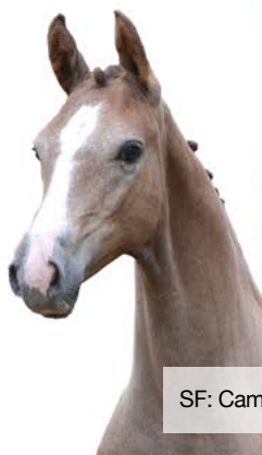
SF: Cambridge x For the Moon