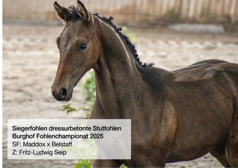
Siegerfohlen dressurbetonte Stutfohlen Burghof Fohlenchampionat 2025 SF: Maddox x Belstaff Z: Fritz-Ludwig Seip