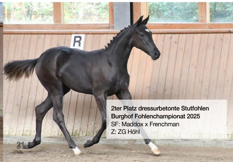
2ter Platz dressurbetonte Stutfohlen Burghof Fohlenchampionat 2025 SF: Maddox x Frenchman Z: ZG Höhl