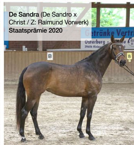
De Sandra (De Sandro x Christ / Z: Raimund Vorwerk) Staatsprämie 2020